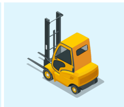
Gabelstapler fährt rückwärts

Nutze für längere Pausen den Block Powerbrain pausiere .