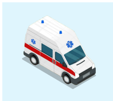
Rettungswagen im Einsatz